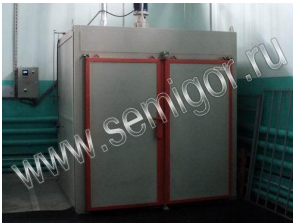
Большая печь для термостатирования