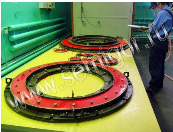
Занесение заливки в цеховой журнал