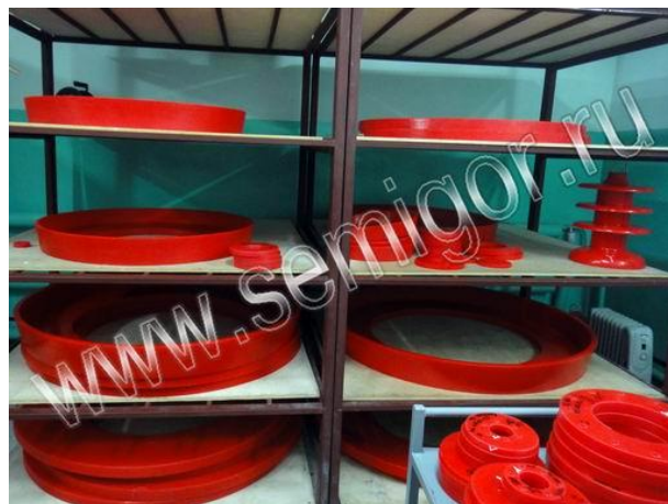
Склад готовой продукции