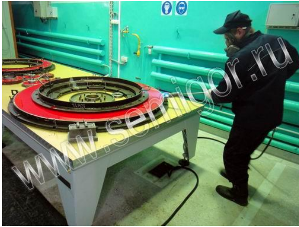
Обработка полиуретана пламенем