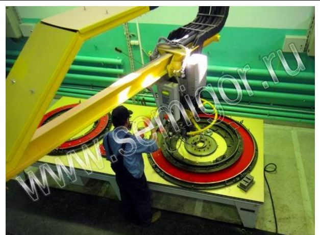
Заливка во вторую форму