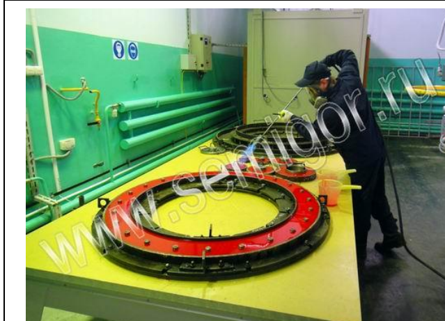
Обработка полиуретана пламенем