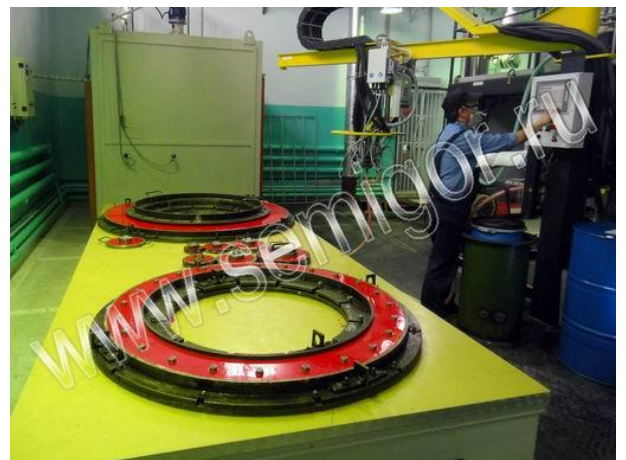
Подготовка машины к следующей заливке