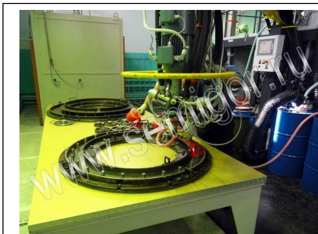
Начало заливки в литьевую форму

Справка: цех полиуретана расположен на нашей производственной базе в п.Ново-Александровка (Орджоникидзевский р-он г.Уфы).