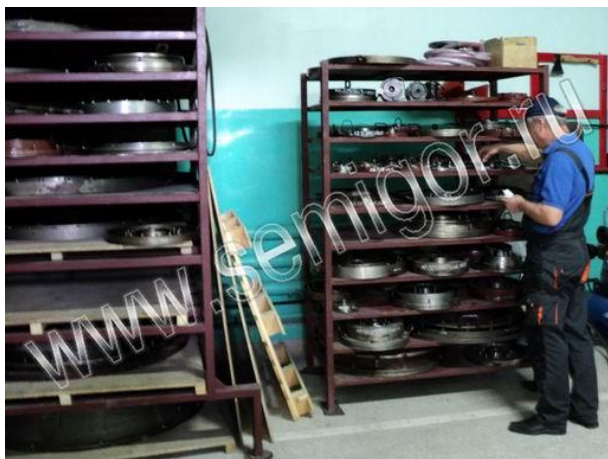
Склад литевых форм