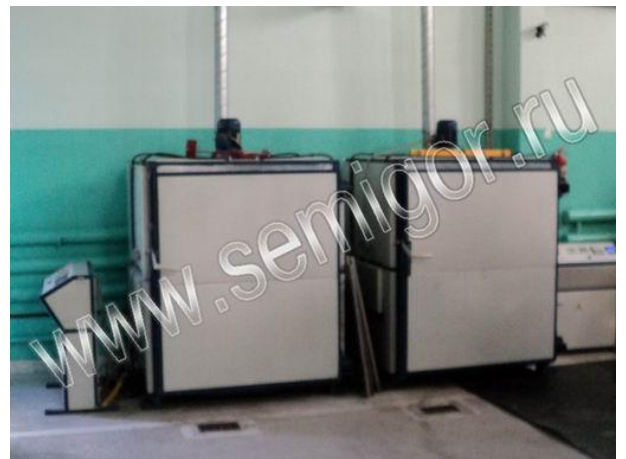
Малые печи для термостатирования