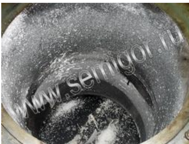
Форма для изготовления поролоновых изделий

Справка: цех поролона расположен на нашей производственной базе в п.Ново-Александровка (Орджоникидзевский р-он г.Уфы) — поролон отливается в формах.