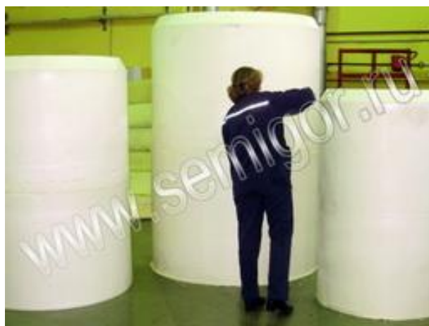
Проверка готовой продукции