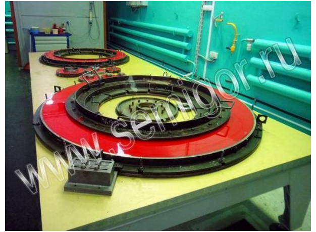
Термостатирование полиуретана в форме на столе подогрева